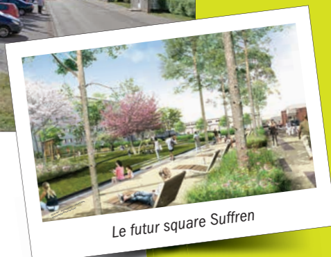
Le futur square Suffren