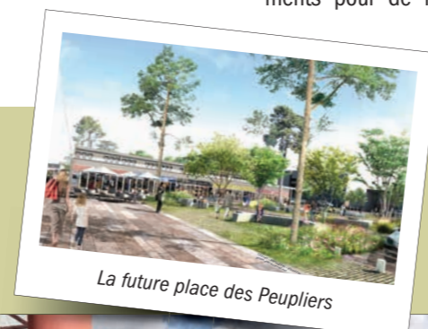
La future place des Peupliers