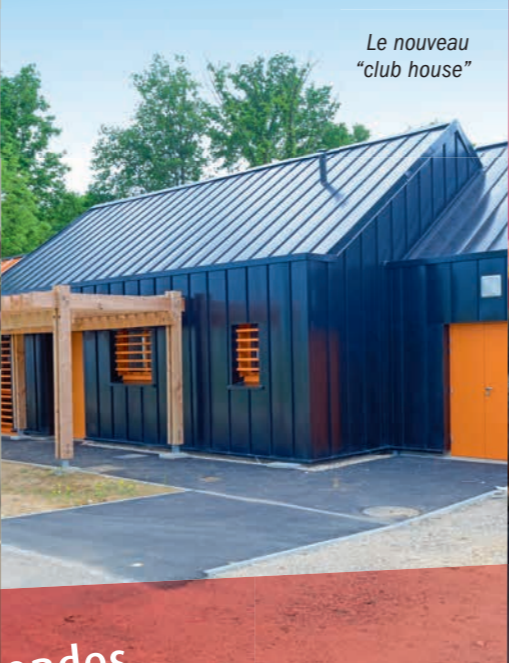
Le nouveau "club house"